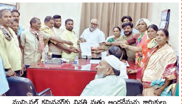
మున్సిపల్ కమిషనరీకి వివరాలను తెలిపే కార్మికులు