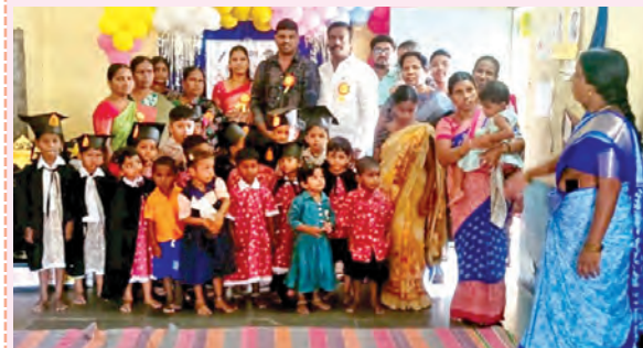
అంగన్వాడీ సంఘం విద్యార్థులకు సత్కారాలను పంపిణీ చేస్తున్న కౌన్సిలర్లు