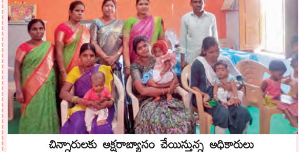
చిన్నారులకు అక్షరాభ్యాసం చేయమని అధికారులు