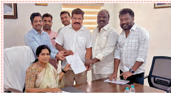
డిప్యూటీ కమిషనరీకి వివరాలను తెలిపే సమయంలో కార్యకర్తలు